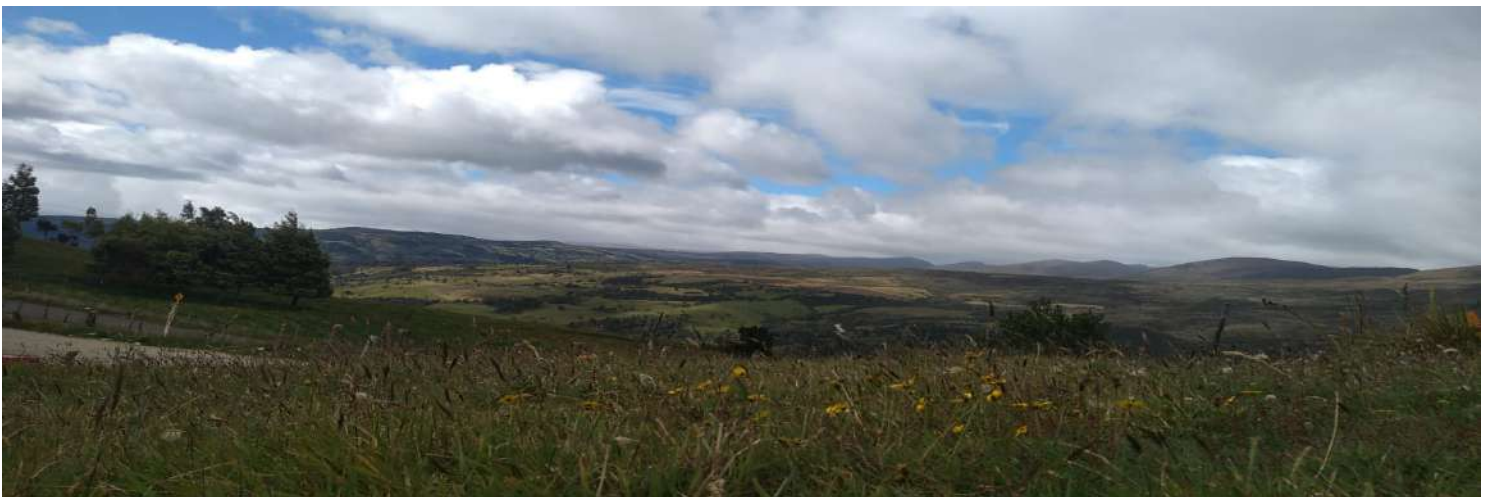
Plan de Sumapaz 29-07-2021