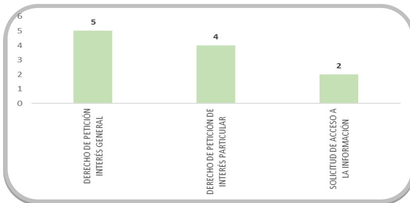
Tipología (Peticiones tramitadas)